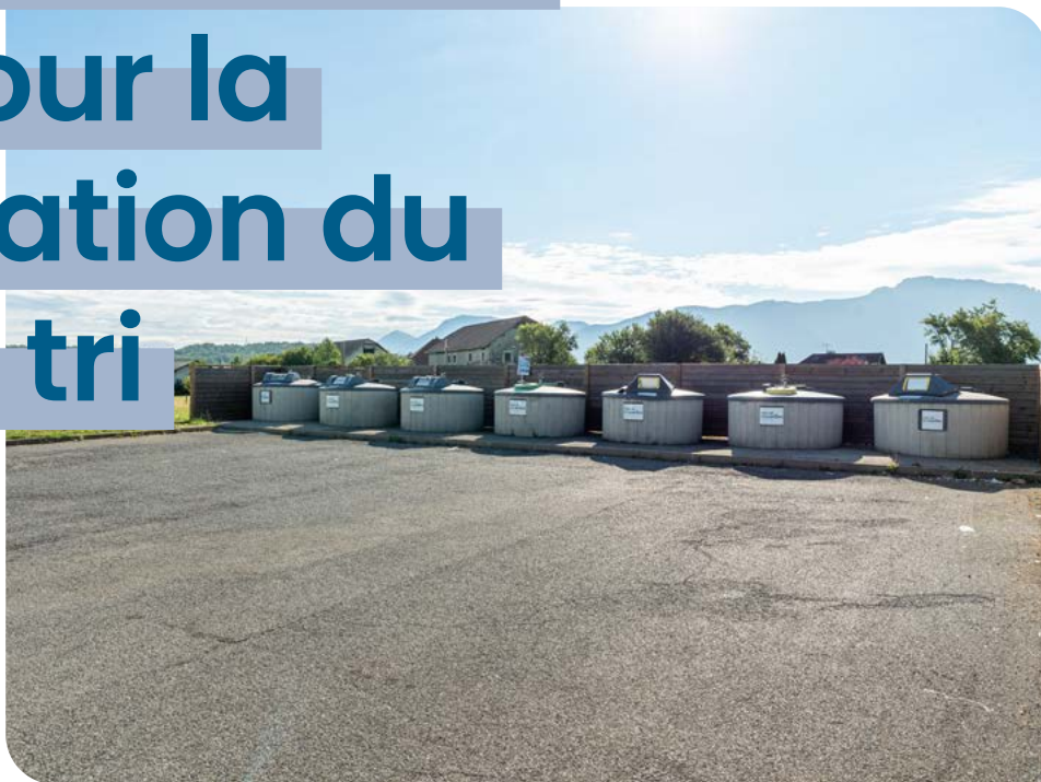
Conteneurs de tri à Cuvat

Depuis le 1 er janvier, tous les emballages se trient !