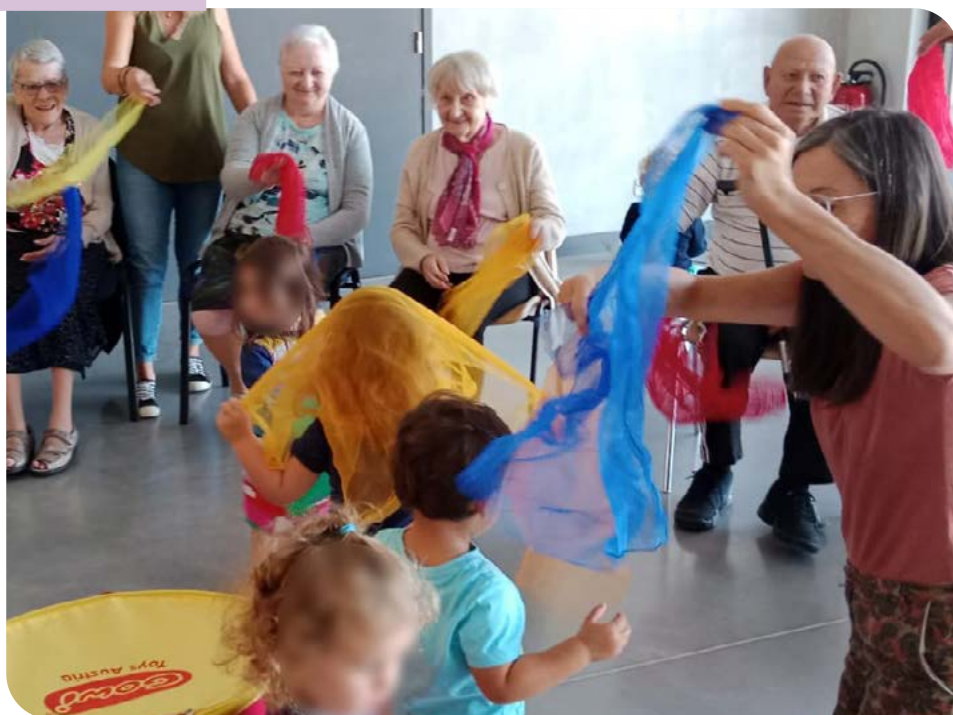
Les rencontres intergénérationnelles avec les résidents de l'EHPAD de Cruseilles.

Nouvelle année, nouveaux projets pour le Relais Petite Enfance du Pays de Cruseilles !