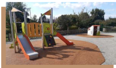
Nouvelle aire de jeux à Cruseilles.

Changement de l'aire de jeux pour un montant de 30 000€ .