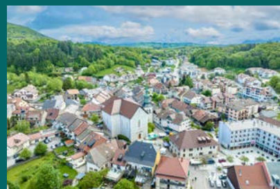
La ville de Cruseilles

C'est un document d'orientation qui définit les priorités en matière de construction pour satisfaire les besoins en logement et hébergement tout en assurant une stratégie foncière économe de l'espace. Enfin, c'est un programme d'actions pour l'ensemble du territoire et pour chaque commune (type de logement à produire dans le parc social et par type de produit, les moyens fonciers à mettre en œuvre, les éventuels objectifs de rattrapage de production de logements aidés).