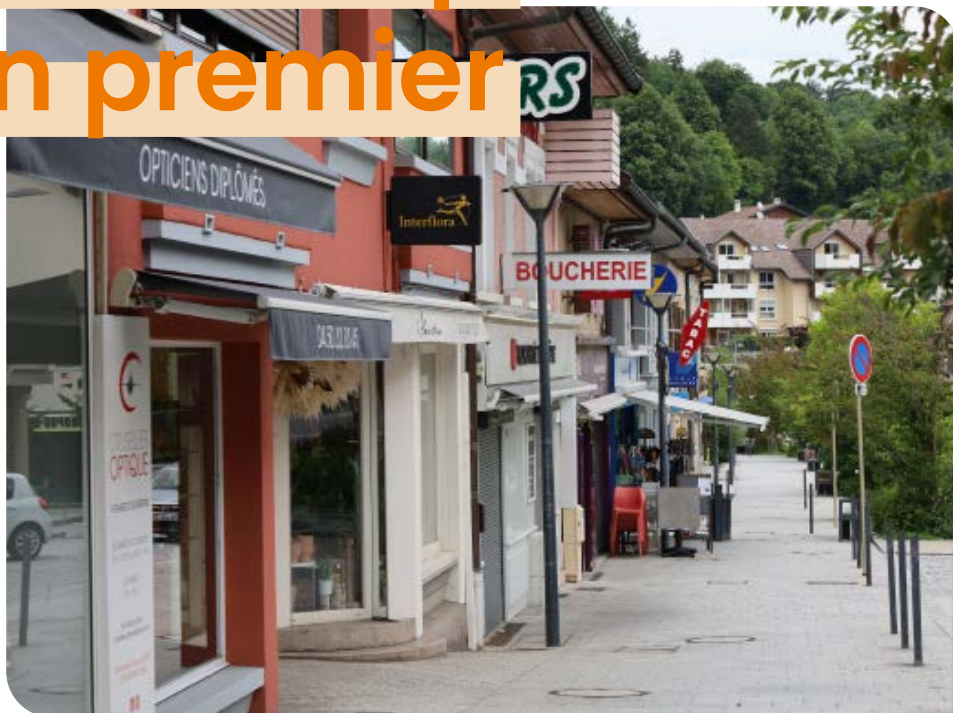
Les commerces de la Grand Rue de Cruseilles.

Dans la saison 1 du podcast «Création d'entreprise, on en parle», ils partagent, trucs, astuces, anecdotes et bourdes à éviter.