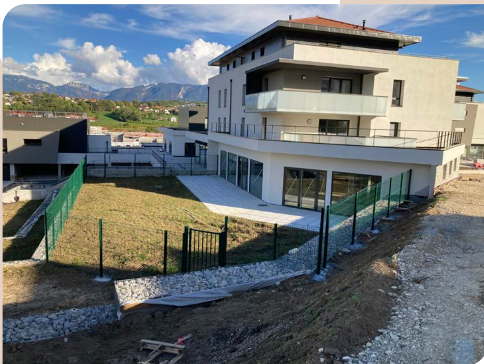
Création d'un multi-accueil à Allonzier la Caille.