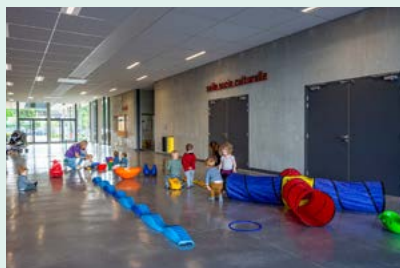
Jeux et motricité au Complexe Sportif Intercommunal du Pays de Cruseilles dans le cadre des matinées d'animations organisées par le RPE

Le Relais Petite Enfance est bien identifié sur le territoire à la fois par les assistant(e)s maternel(le)s et par les parents. Le RPE itinérant organise des ateliers 4 jours par semaine à Menthonnex-en-Bornes, Allonzier la Caille, Copponex et Villy-le-Pelloux. Il s'agit de poursuivre le travail en itinérance du RPE pour faciliter l'accès à toutes les familles du territoire, encourager la formation continue et analyser les besoins du territoire en matière d'accueil du jeune enfant.