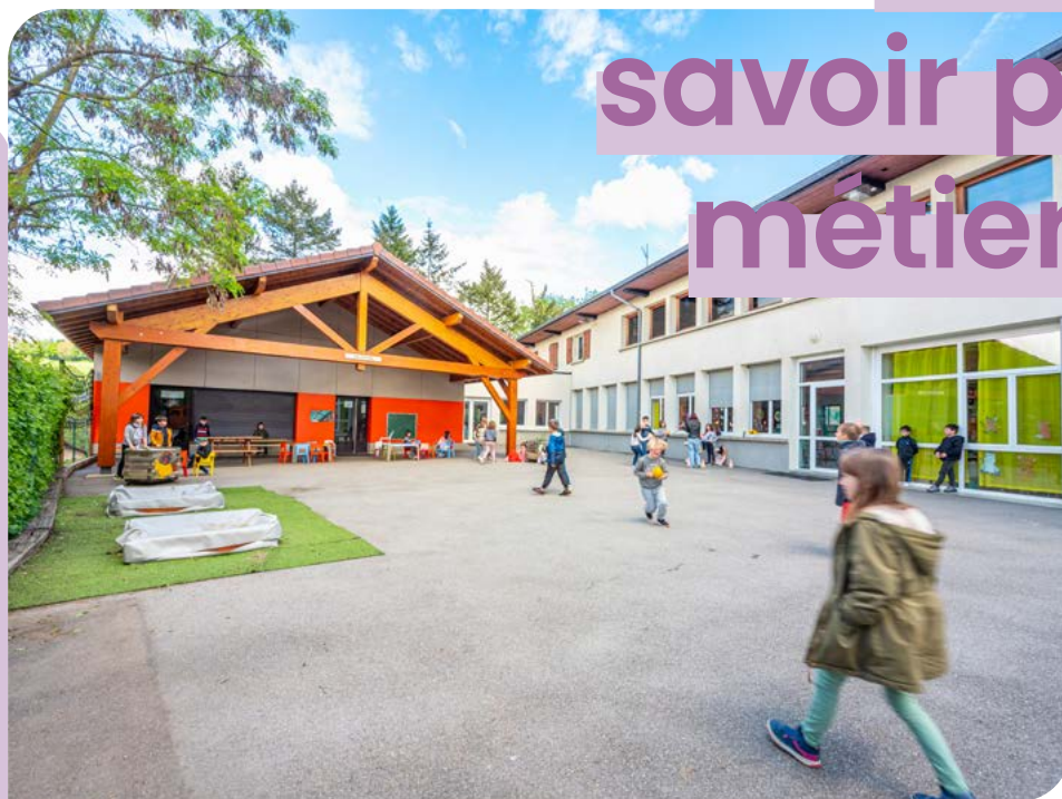
Ecole de Copponex - ©Thomas Garcia.