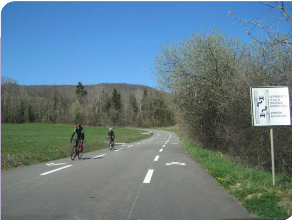
Exemple d'aménagement : la chaussée à voie centrale bandalisée.