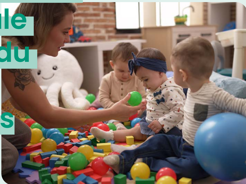
La CTG soutient la création de maison d'assistant(e)s maternel(le)s - ©Freepik.

La Convention Territoriale Globale (CTG) du Pays de Cruseilles a été signée le 28 novembre dernier.