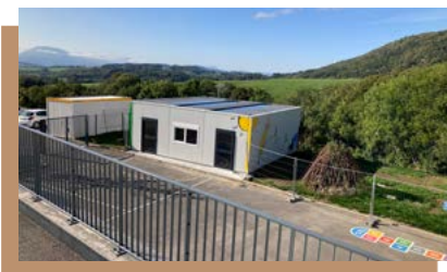
Ouverture d'une 6 ème classe à Vovray-en-Bornes.