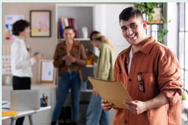
La CTG souhaite promouvoir l'accompagnement des jeunes dans leurs projets - ©Freepik.

La Communauté de Communes du Pays de Cruseilles s'est lancée en mars 2023 dans une démarche de contractualisation aux côtés de la Caisse d'Allocations Familiales de la Haute-Savoie (CAF) pour sa Convention Territoriale Globale (CTG).