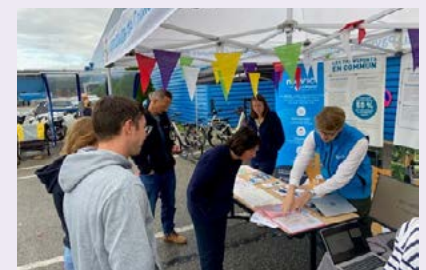
Retour en image sur la journée de la mobilité au PAE de la Caille.

Organisée en partenariat avec Pilot Europe, Le Marché du Vélo et l'Agence Ecomobilité, cette journée a confirmé l'intérêt de poursuivre l'élaboration du plan de mobilité inter-entreprises. Il définira les actions à mener à l'échelle du PAE de la Caille mais aussi au sein de chaque entreprise volontaire.