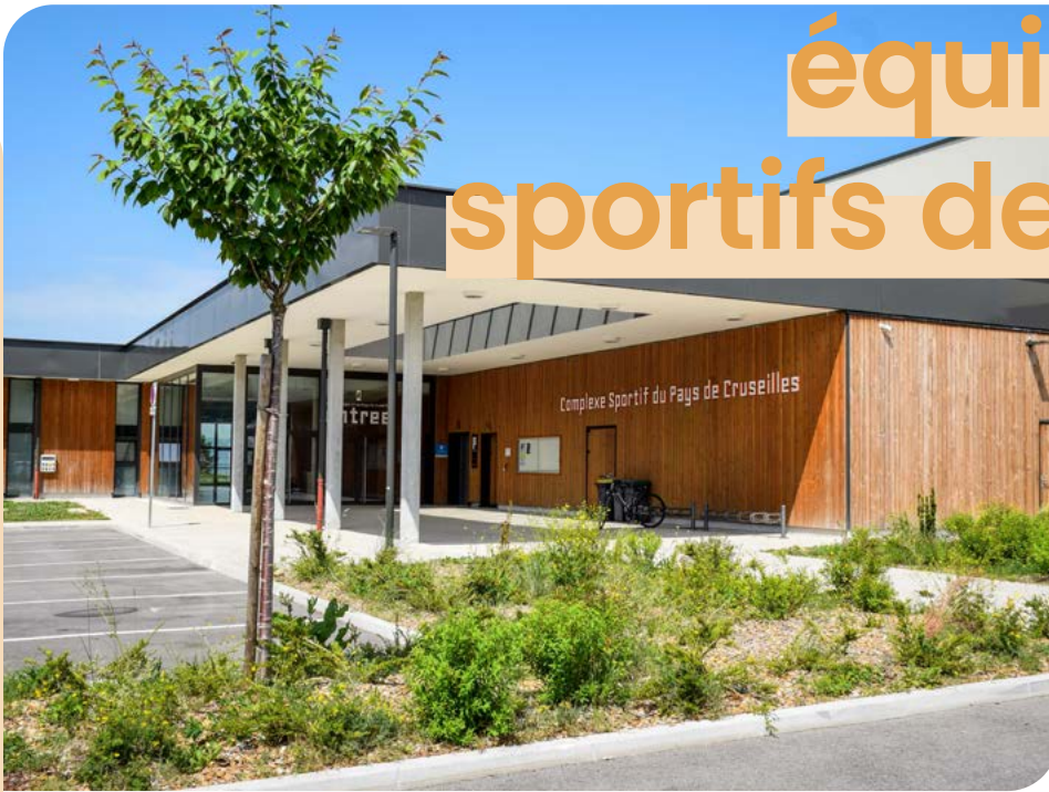
Complexe Sportif Intercommunal du Pays de Cruseilles.