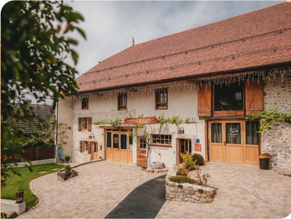
Auberge de Charly et ses filles à Andilly