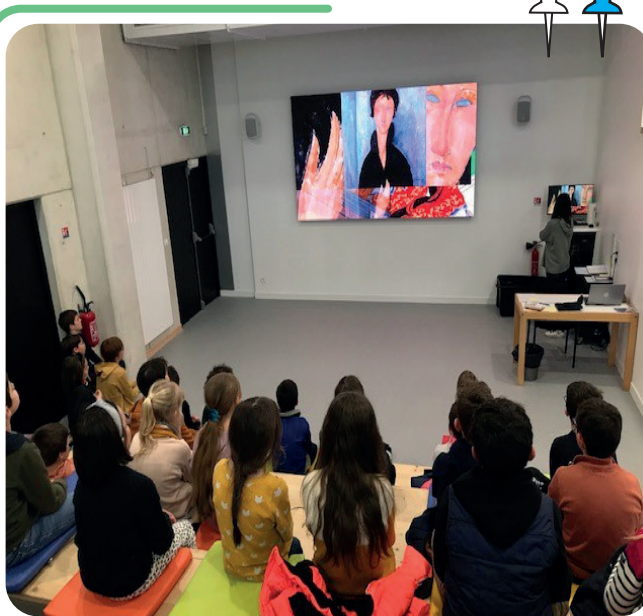
Projet Micro-Folie et École de Musique

Cette pratique permet de développer l'autonomie, le raisonnement. Stimuler et affiner ces paramètres permettent d'améliorer les apprentissages sans oublier le respect de l'autre, l'écoute, construire des valeurs solides telles que : s'ouvrir sur le monde artistique et le comprendre, se responsabiliser dans un projet, apprendre à fournir un effort pour un résultat, négocier et prendre des décisions en groupe et pour le groupe, trouver sa place pour que ce dernier fonctionne.